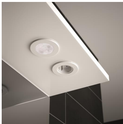
Détail spot + prise