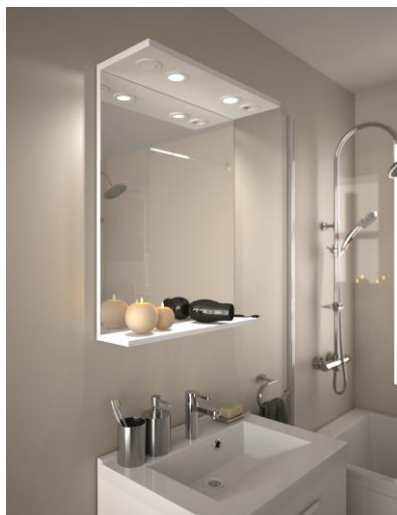
Miroir lumibloc tablette